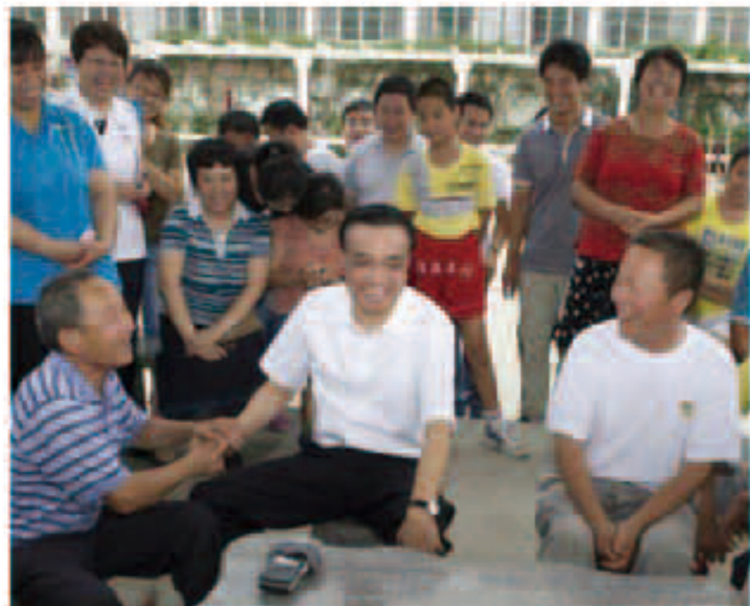
2014年7月24日上午,李克强总理来德州京桥社区亲切询问社区居民的生活状况,并让大家提要求,座谈会大约持续20分钟,总理关心民生问题,非常亲民,座谈会一片欢乐气氛中结束。