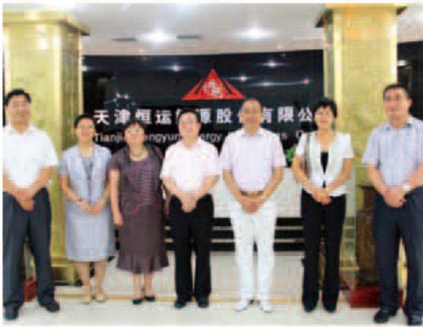
采访团在恒运能源集团合影