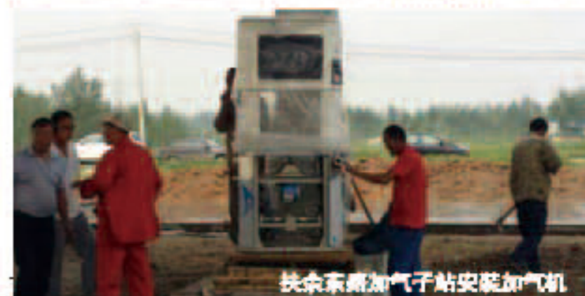
扶余东路加气站安装加气机

集团旗下昆仑燃气有限公司各个加气站进展顺利,其中扶余东路加气站的所有设备正在安装中。7月22日,扶余东路加气站罐体,安全顺利的完成吊装,25日,保质保量的完成加气机的安装,预计此站一个月左右可以对外运营加气。