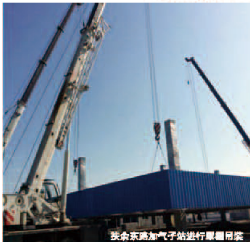
扶余东路加气站进行罐体吊装