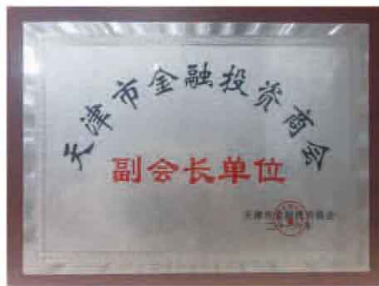
天津市金融投资商会于2014年成立，是经天津市社团局以及天津市工商联联合牵头并批准成立的金融整合服务