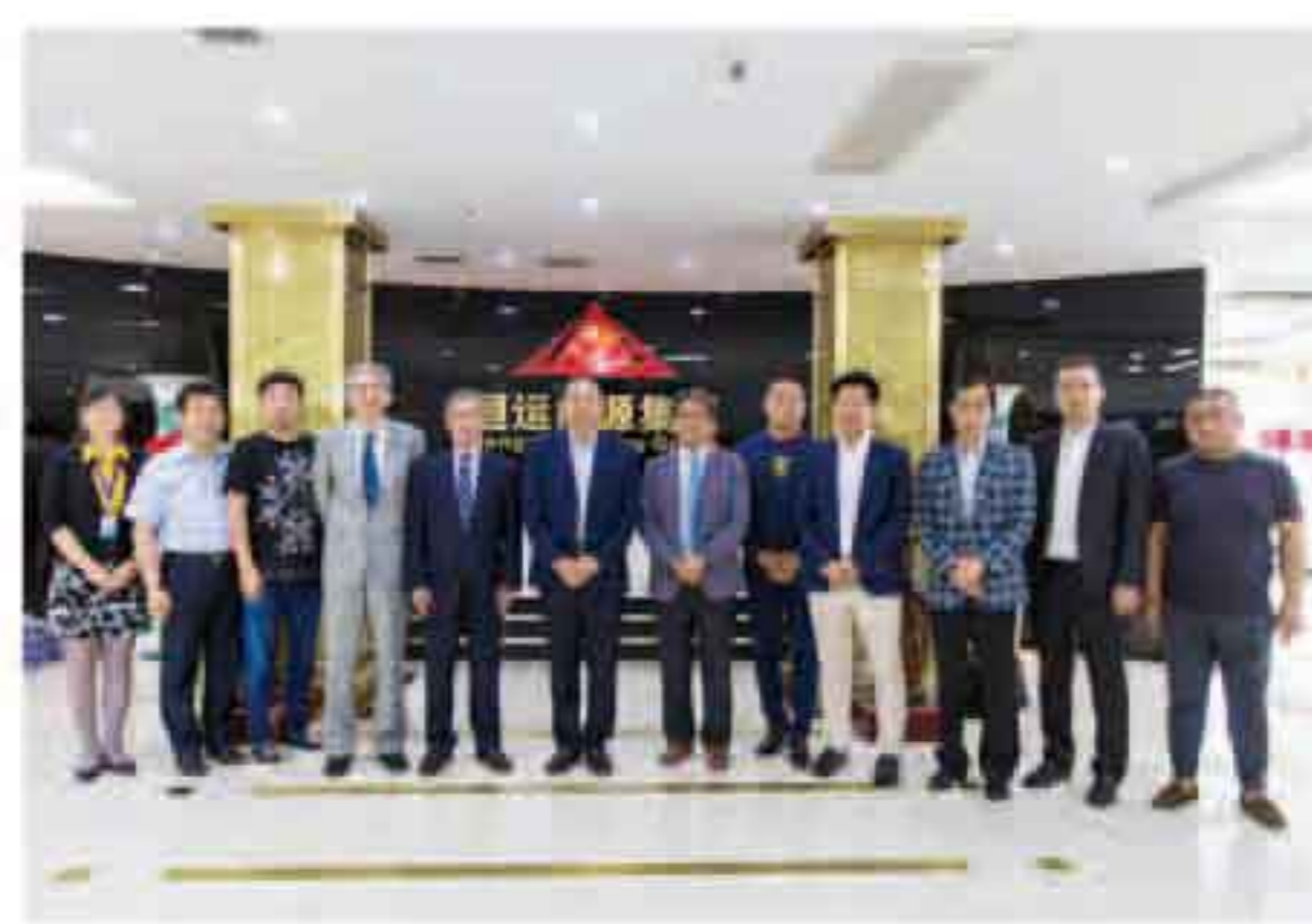
2016年5月18日，韩国BEATCO DBA Inc. 高层领导